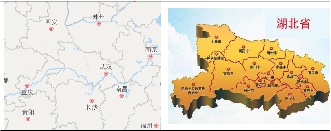
图表 2 湖北省区位图

国道在湖北省境内交织；截至 2021 年末湖北省公路总里程达 296921.76 公里；高速公路里程达 7378.06 公里。铁路方面，湖北省境内的铁路线有京广线、京九线、武九铁路、襄渝线、汉丹线、焦柳线、长荆线、宜万铁路及渝利铁路等；湖北省高铁网形成了以武汉站、武昌站、汉口站为中心的放射状格局，主要高铁线路有京广高铁、沪蓉高铁、汉十高铁、武九客运专线、武冈城际铁路、武孝城际铁路、武咸城际铁路及仙桃城际铁路等，截至 2022 年末，湖北省高铁里程达 2056 公里，居全国第 9 位。水路方面，由长江、汉江以及各大支流构成的水路网在湖北省立体交通格局中发挥着重要作用。航空方面，武汉天河国际机场是华中地区规模最大、功能最齐全的现代化航空港，是全国十大机场之一；此外，湖北省已启用的民航机场还包括宜昌三峡国际机场、襄阳刘集机场、恩施许家坪机场、神农架红坪机场、十堰武当山机场及荆州沙市机场等。