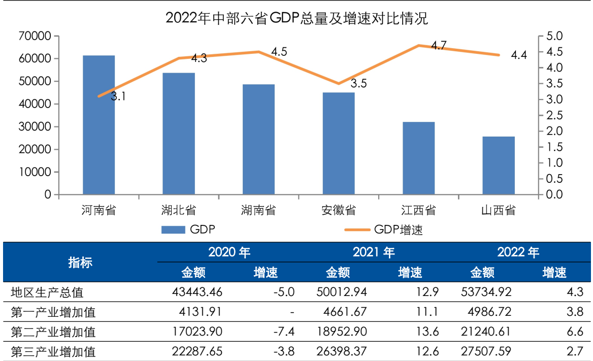
图表 3 湖北省主要经济指标及对比情况（单位：亿元、%）

中排名第 2 位。分产业看，2022 年，湖北省第一产业增加值 4986.72 亿元，同比增长 3.8%；第二产业增加值 21240.61 亿元，同比增长 6.6%；第三产业增加值 27507.59 亿元，同比增长 2.7%。