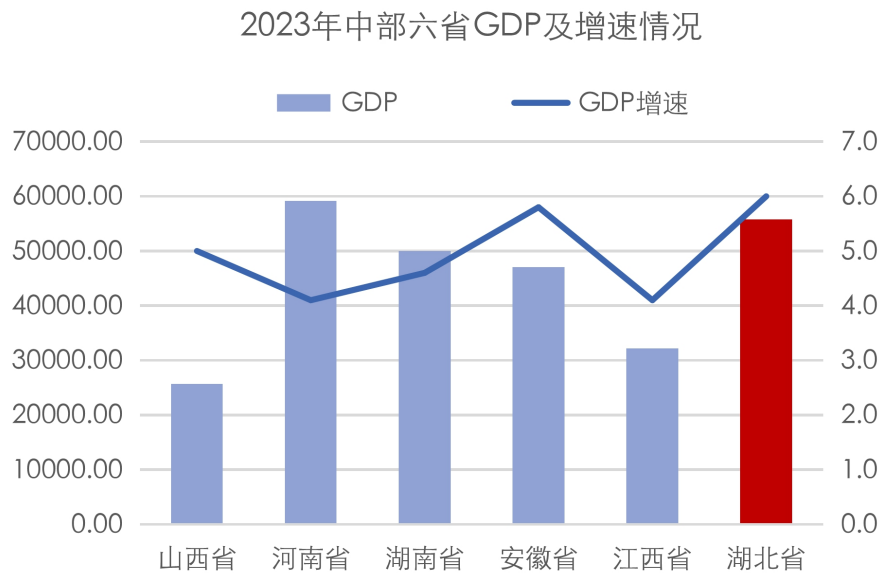
图表3 湖北省主要经济指标及对比情况（单位：亿元、%）

2024年上半年，湖北省实现地区生产总值27346.45亿元，按不变价格计算，同比增长5.8%。分产业看，第一产业增加值同比增长3.1%；第二产业增加值同比增长6.6%；第三产业增加值同比增长5.6%。