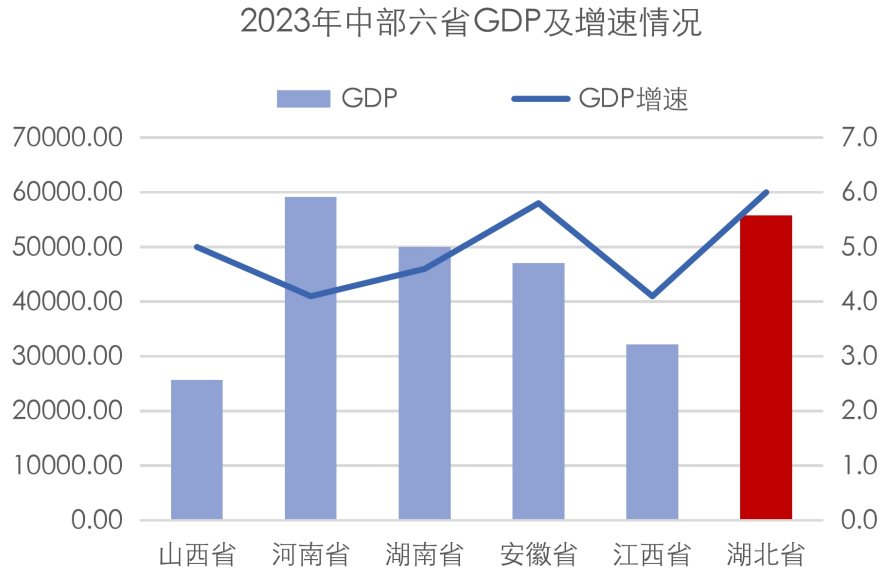
图表 2 湖北省主要经济指标及对比情况（单位：亿元、%）