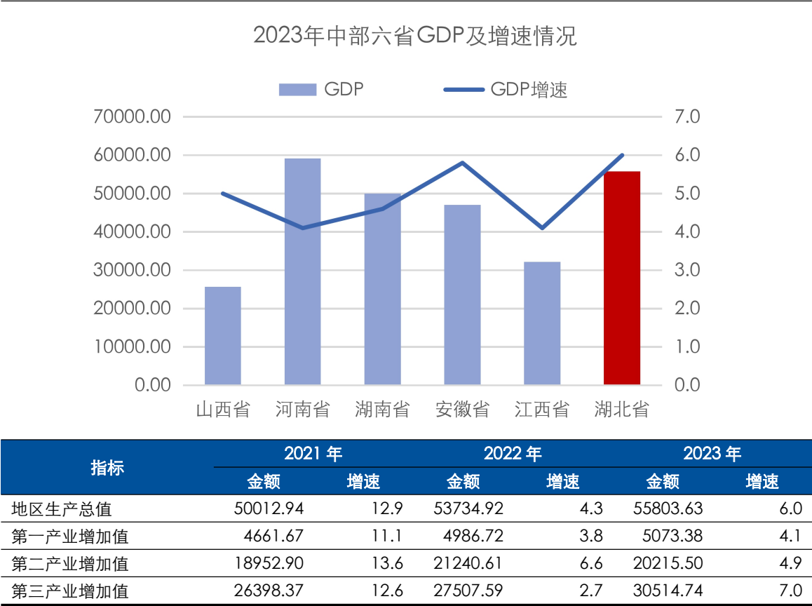
图表 2 湖北省主要经济指标及对比情况（单位：亿元、%）