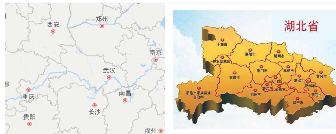
图表 1 湖北省区位图