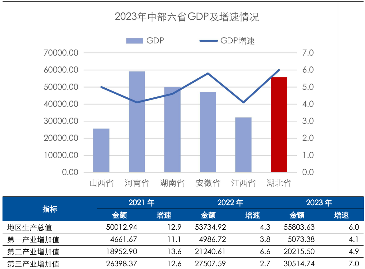
图表3 湖北省主要经济指标及对比情况（单位：亿元、%）