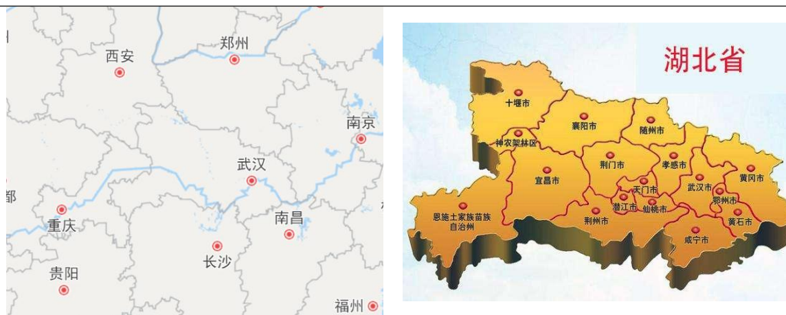
图表 2 湖北省区位图

际铁路、武孝城际铁路、武咸城际铁路及仙桃城际铁路等。水路方面，由长江、汉江以及各大支流构成的水路网在湖北省立体交通格局中发挥着重要作用。航空方面，武汉天河国际机场是华中地区规模最大、功能最齐全的现代化航空港，是全国十大机场之一；此外，湖北省已启用的民航机场还包括宜昌三峡国际机场、襄阳刘集机场、恩施许家坪机场、神农架红坪机场、十堰武当山机场及荆州沙市机场等。