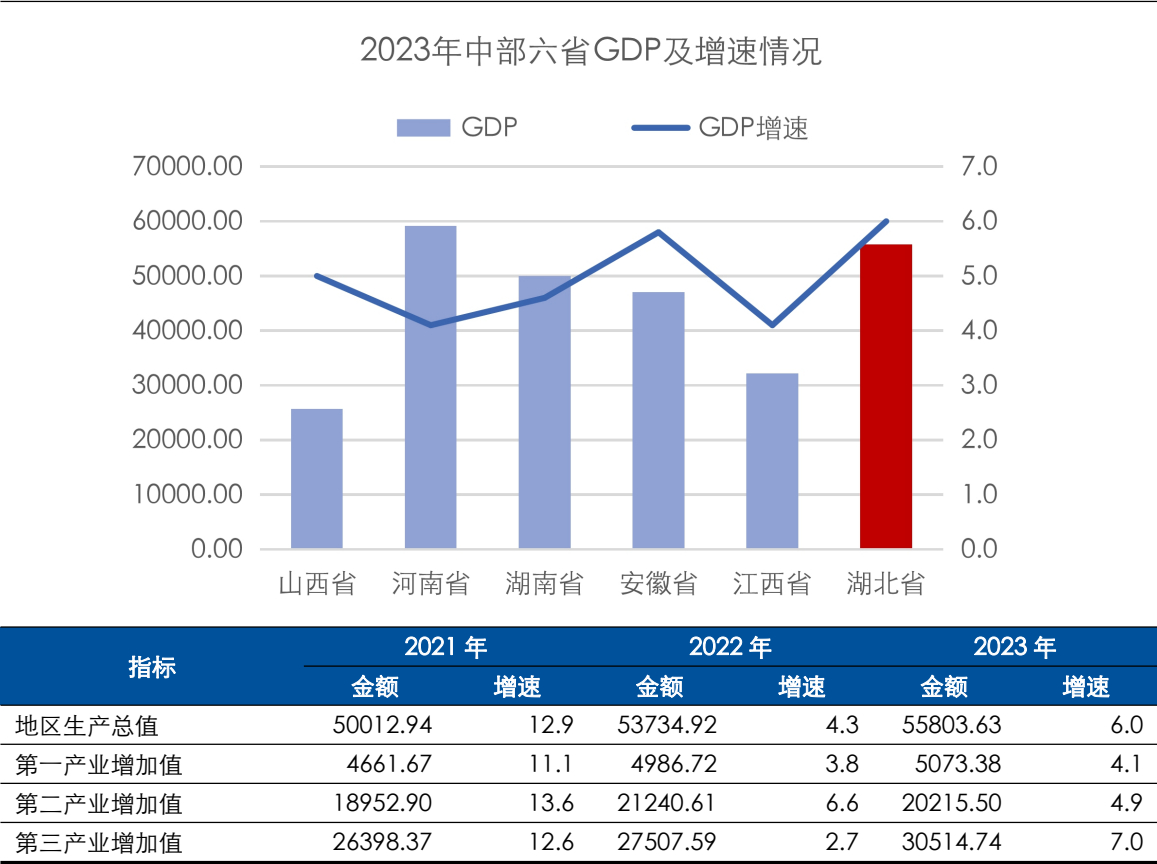
图表 3 湖北省主要经济指标及对比情况（单位：亿元、%）