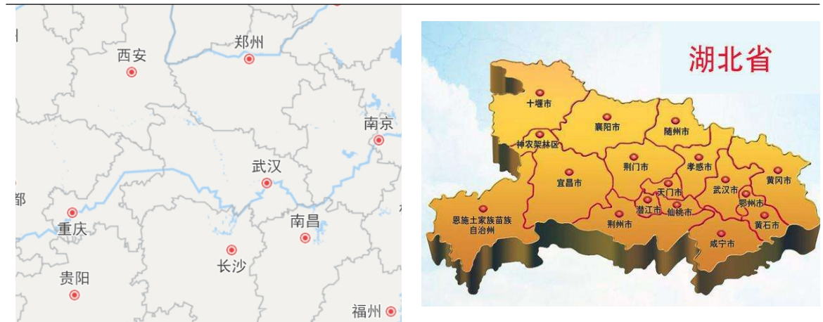
图表2 湖北省区位图

中心的放射状格局，主要高铁线路有京广高铁、沪蓉高铁、汉十高铁、武九客运专线、武冈城际铁路、武孝城际铁路、武咸城际铁路及仙桃城际铁路等。水路方面，由长江、汉江以及各大支流构成的水路网在湖北省立体交通格局中发挥着重要作用。航空方面，武汉天河国际机场是华中地区规模最大、功能最齐全的现代化航空港，是全国十大机场之一；此外，湖北省已启用的民航机场还包括宜昌三峡国际机场、襄阳刘集机场、恩施许家坪机场、神农架红坪机场、十堰武当山机场及荆州沙市机场等。