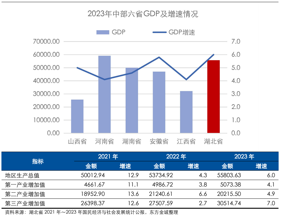
图表 3 湖北省主要经济指标及对比情况（单位：亿元、%）