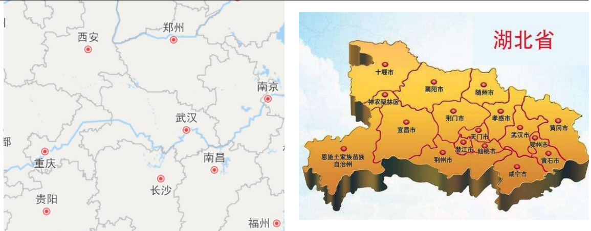
图表2 湖北省区位图

中心的放射状格局，主要高铁线路有京广高铁、沪蓉高铁、汉十高铁、武九客运专线、武冈城际铁路、武孝城际铁路、武咸城际铁路及仙桃城际铁路等。水路方面，由长江、汉江以及各大支流构成的水路网在湖北省立体交通格局中发挥着重要作用。航空方面，武汉天河国际机场是华中地区规模最大、功能最齐全的现代化航空港，是全国十大机场之一；此外，湖北省已启用的民航机场还包括宜昌三峡国际机场、襄阳刘集机场、恩施许家坪机场、神农架红坪机场、十堰武当山机场及荆州沙市机场等。