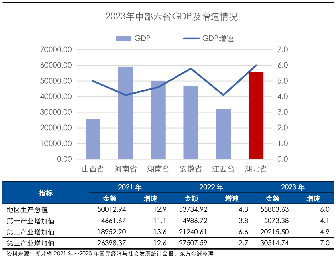
图表 3 湖北省主要经济指标及对比情况（单位：亿元、%）