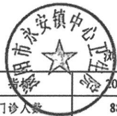
永安市永安镇中心卫生院