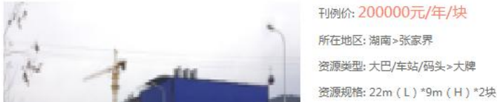
张花高速张家界出入口500m处单立柱