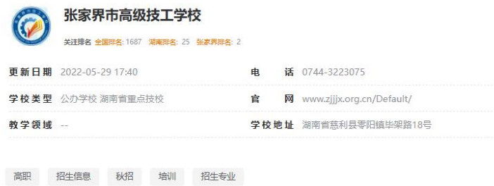
张家界市高级技工学校招生专业