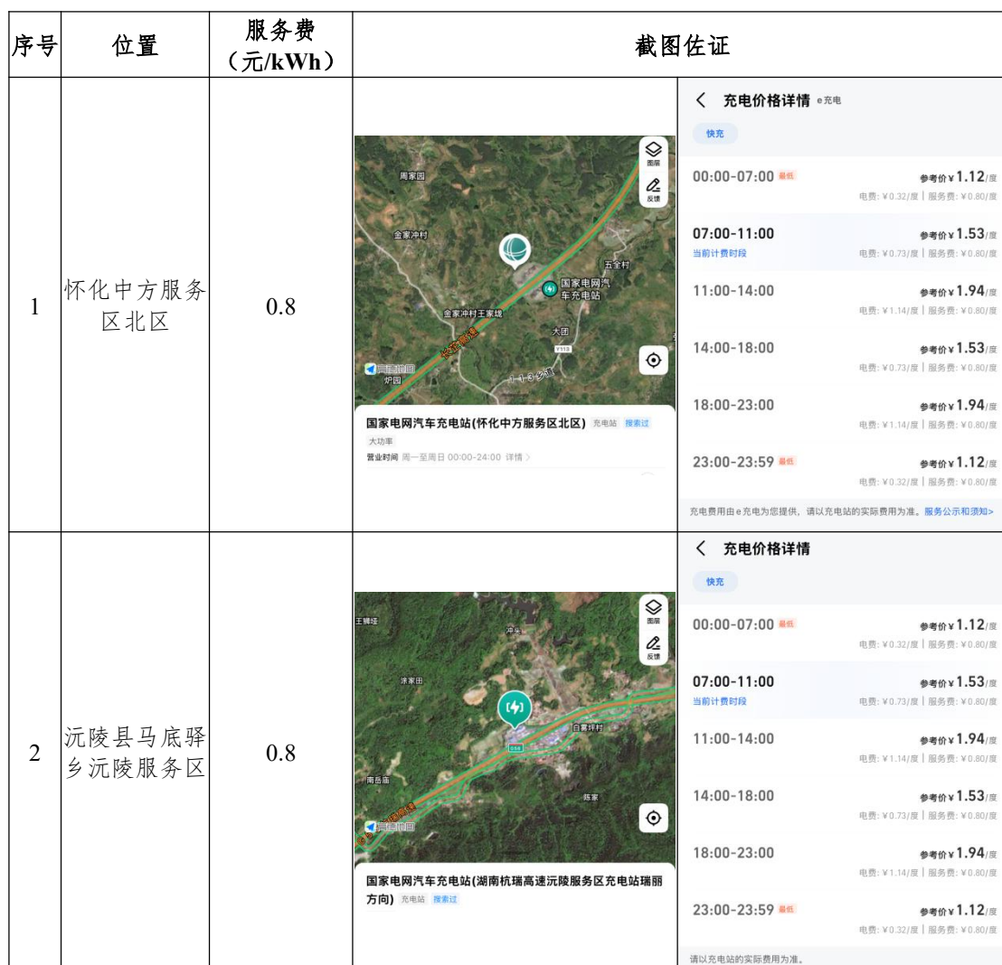
项目周边充电服务收费价格

根据《湖南省发展和改革委员会关于我省电动汽车用电价格政策有关问题的通知》（湘发改价商〔2018〕407号）规定，结合对周边区域充电桩充电服务费调查，项目周边充电服务费为 0.8 元/kwh，考虑到本项目的定位、特色及区位因素，根据审慎性原则，预计本项目充电桩收入仅考虑充电服务费为 0.80 元/kwh。（不考虑充电电费，电费既不计入成本也不计入收入，由国家电网收取）。