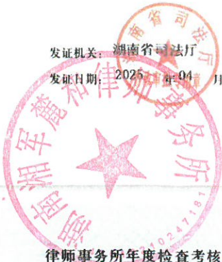
律师事务所变更登记 (八)