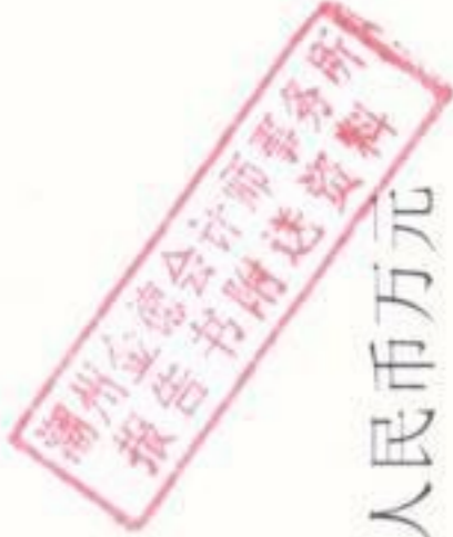
附表三：项目融资还本付息情况