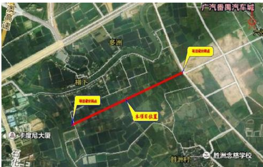
图 2 广汽新能源汽车产业园金山南路工程地理位置图