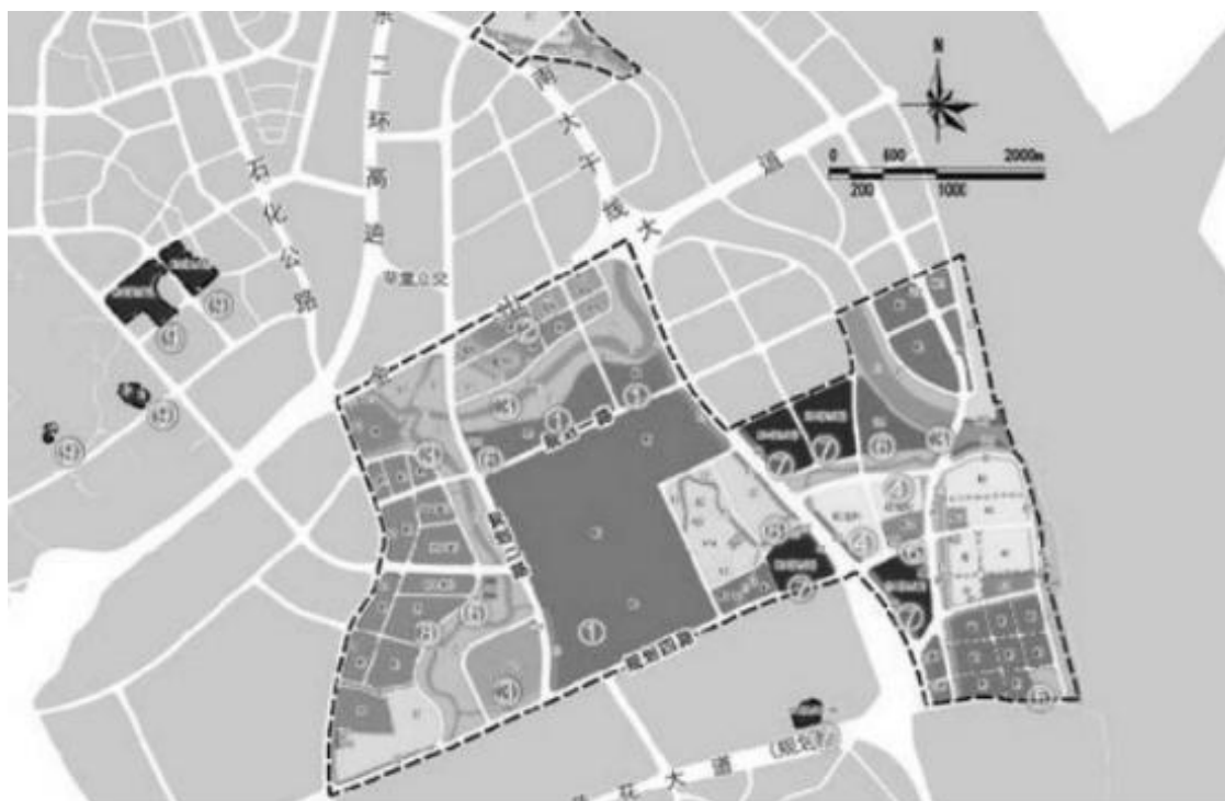
图 1 项目实施范围示意图

拟建项目建设规模：规划总用地面积约 50000 m 2 ，可建设用地面积约 38390 m 2 ，总建筑面积 117645 m 2 （含地下停车库 23703 m 2 ）。