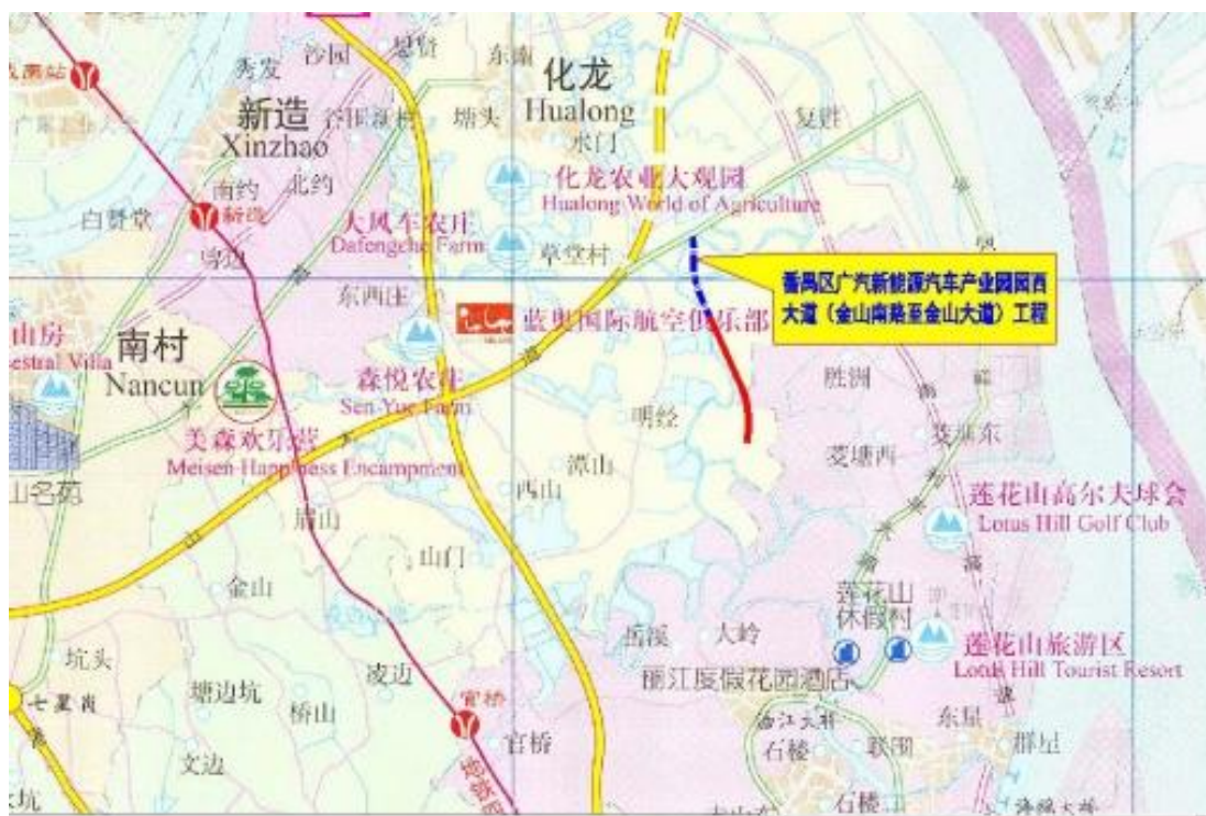
图 3 番禺区广汽新能源汽车产业园园西大道工程地理位置图