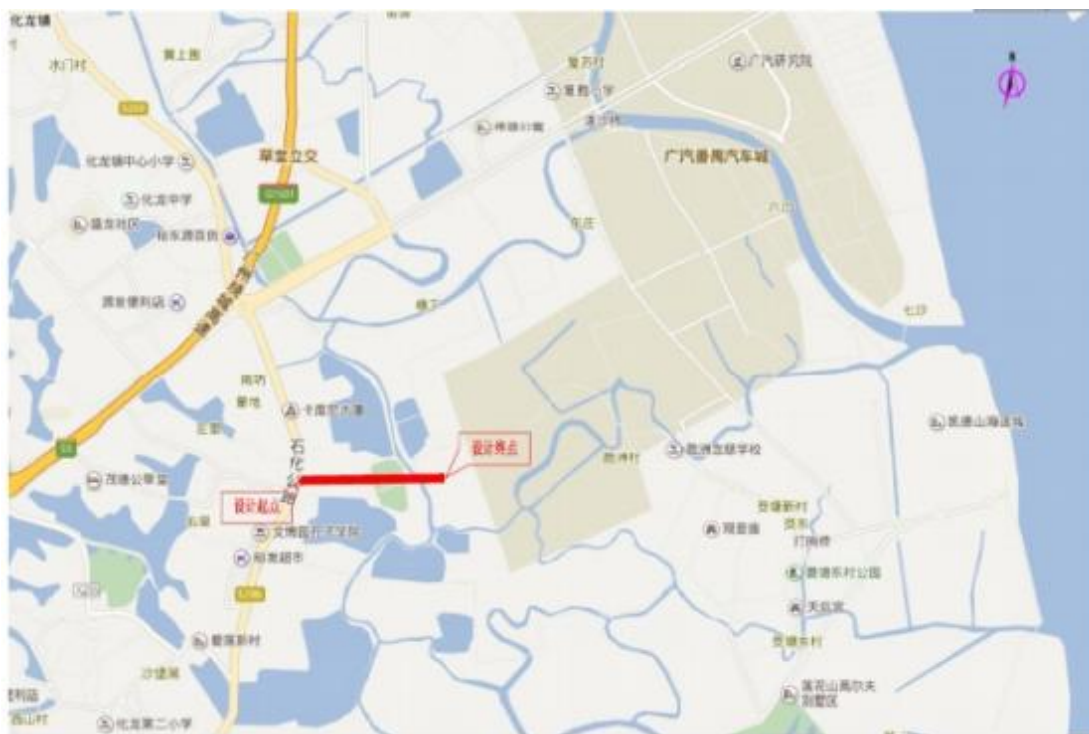
图 6 番禺区广汽新能源汽车产业园金利大道工程地理位置图