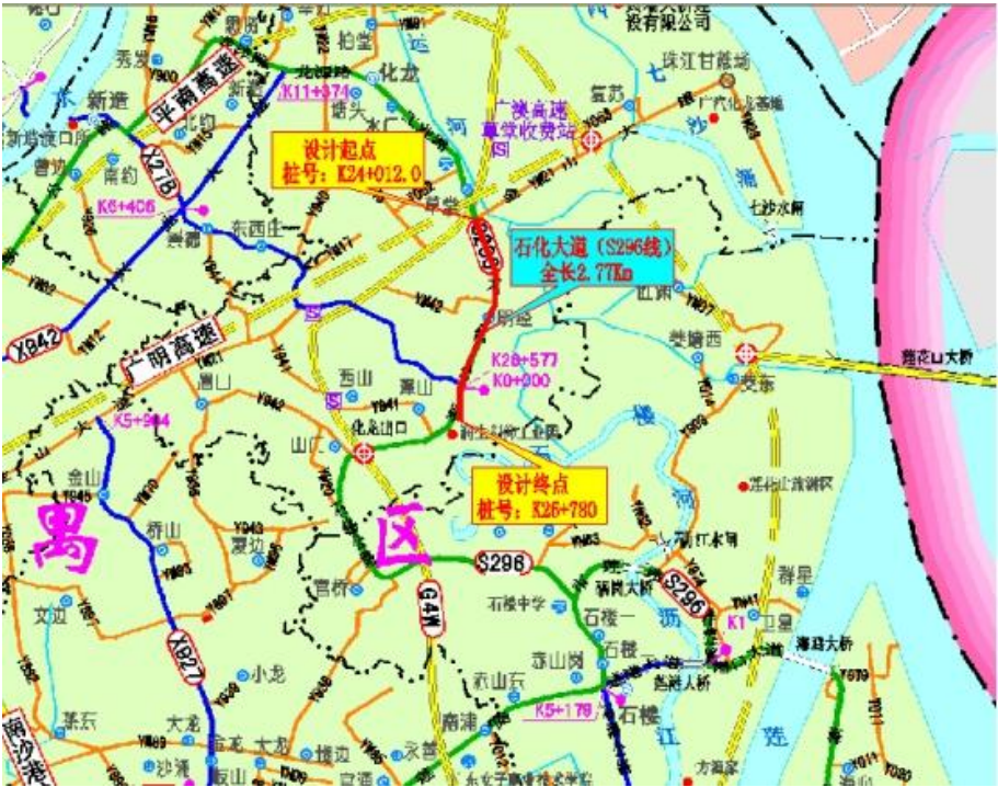
图 7 番禺区化龙镇石化大道(草堂平交以南段)拓宽工程地理位置图

路线南起于金山大道、北至规划路，道路全长约 581m，近期实施道路宽度为 15m，为城市支路，双向两车道，设计速度 40km/h。