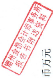
附表二：专项债券还本付息表