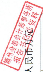
附表一：项目运营期净收益明细表