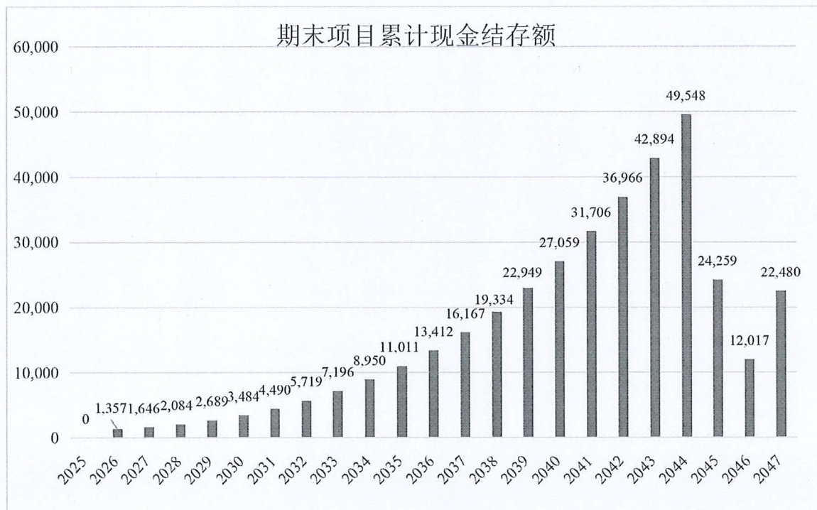
图 1：债券存续期内资金留存情况

综上，针对本项目在专项债券存续期内还本付息资金的测算，我们未注意到可能对相关项目资金稳定性产生重大影响的情况。