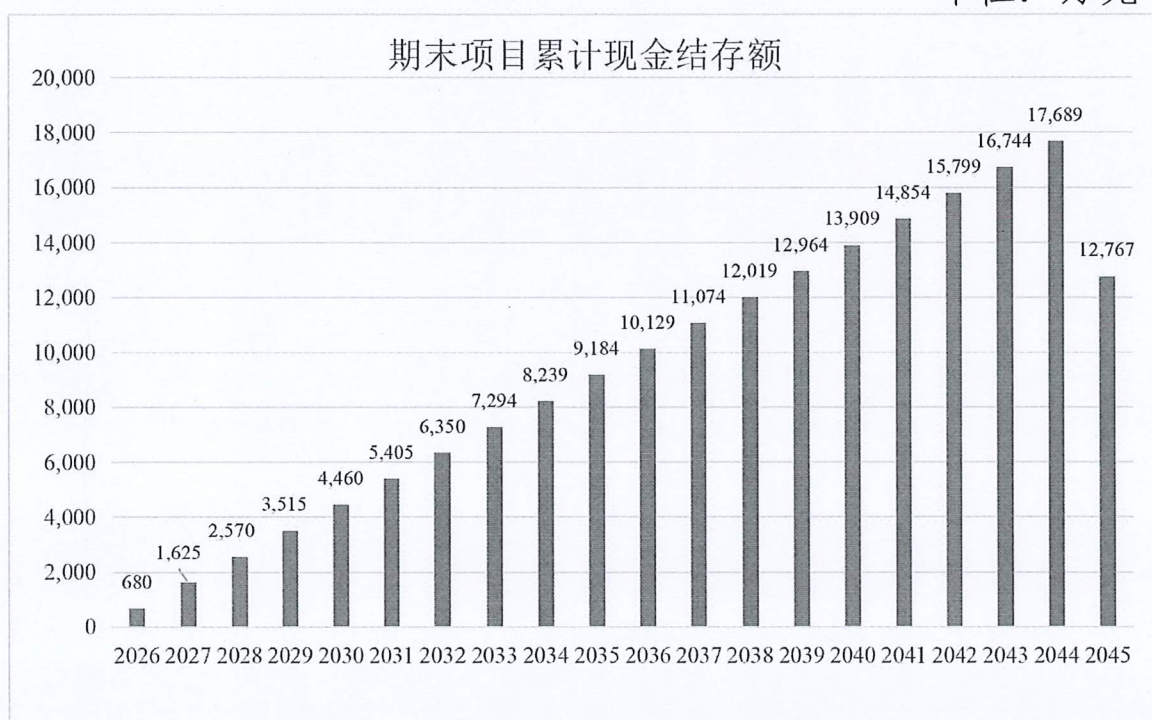
图 1：债券存续期内资金留存情况

综上，针对本项目在专项债券存续期内还本付息资金的测算，我们未注意到可能对相关项目资金稳定性产生重大影响的情况。