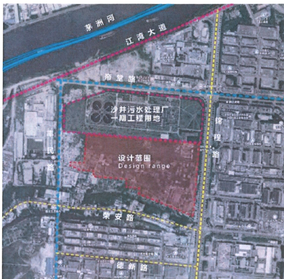
图 2 沙井街道体育公园工程位置示意图

项目为新建项目，已于 2024 年 9 月开工，预计 2027 年竣工验收投入使用。