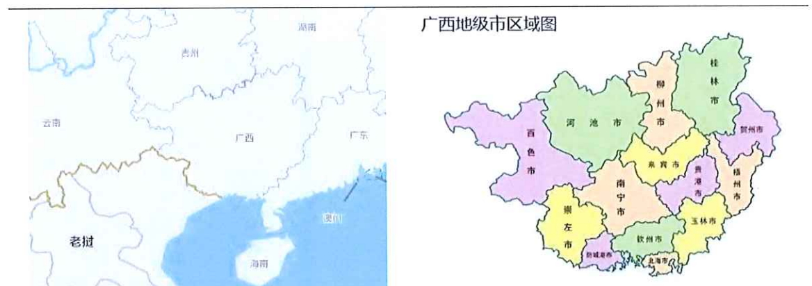
图表 2 广西壮族自治区区位图

广西壮族自治区陆、海、空交通较为便利。铁路方面，广西壮族自治区境内已开通湘桂铁路等重要路线，铁路总里程达 5191 公里；轨道交通方面，在建轨道交通的城市主要包括南宁、柳州和桂林；高铁方面，广西壮族自治区拥有南广高铁、柳南城际铁路、南凭高铁、南昆高铁、南钦高铁、贵南高铁、南钦高铁、钦防高铁和钦北高铁等高铁路线，高铁营运里程已达 1771 公里；水路运输方面，北部湾港与东盟国家的 47 个港口建立海上运输往来，开通内外贸航线 44 条，其中外贸航线 29 条，基本实现了东南亚地区全覆盖；机场方面，广西壮族自治区已建成南宁、柳州、桂林、梧州、北海、河池、百色等七个民航机场，南宁吴圩国际机场和桂林两江国际机场均已开通国际航线。