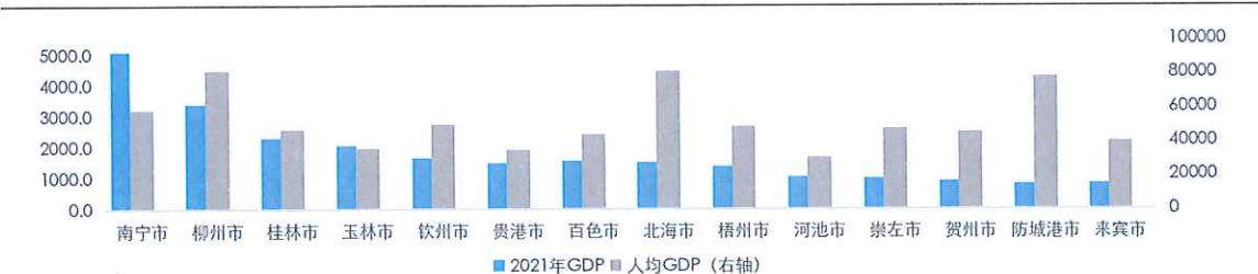
图表 4 广西壮族自治区下属地级市 2021 年经济发展数据（单位：亿元、元）

注：人均 GDP 按照地区生产总值/常住人口估算所得；资料来源于广西壮族自治区下属各地级市 2021 年国民经济和社会发展统计公报，东方金诚整理