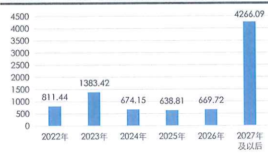
截至 2021 年末广西政府债务期限结构 (亿元)