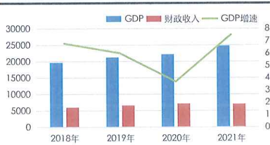
广西经济财政指标 (亿元、%)