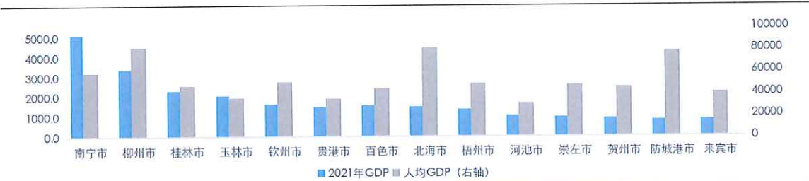
图表3 广西壮族自治区下属地级市2021年经济发展数据（单位：亿元、元）

注：人均GDP按照地区生产总值/常住人口估算所得；资料来源于广西壮族自治区下属各地级市2021年国民经济和社会发展统计公报，东方金诚整理