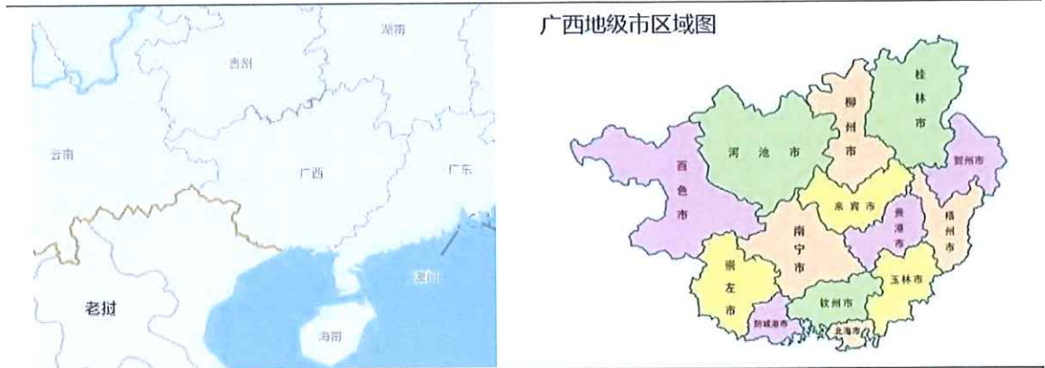
图表 1 广西壮族自治区区位图

成南宁、柳州、桂林、梧州、北海、河池、百色等七个民航机场，南宁吴圩国际机场和桂林两江国际机场均已开通国际航线。