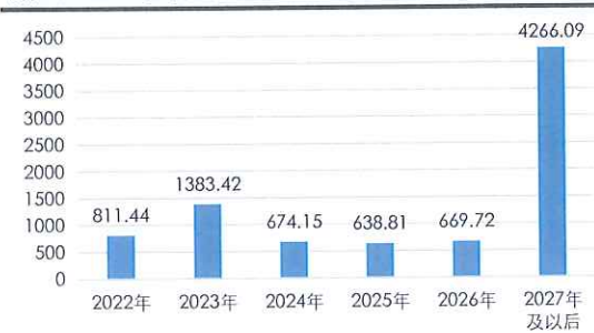
截至2021年末广西政府债务期限结构 (亿元)