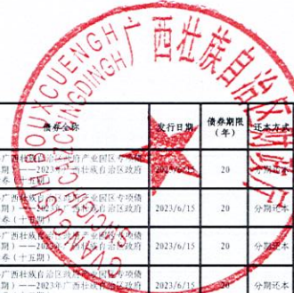
2023年广西壮族自治区政府专项债券（十三至十五期）项目信息披露表