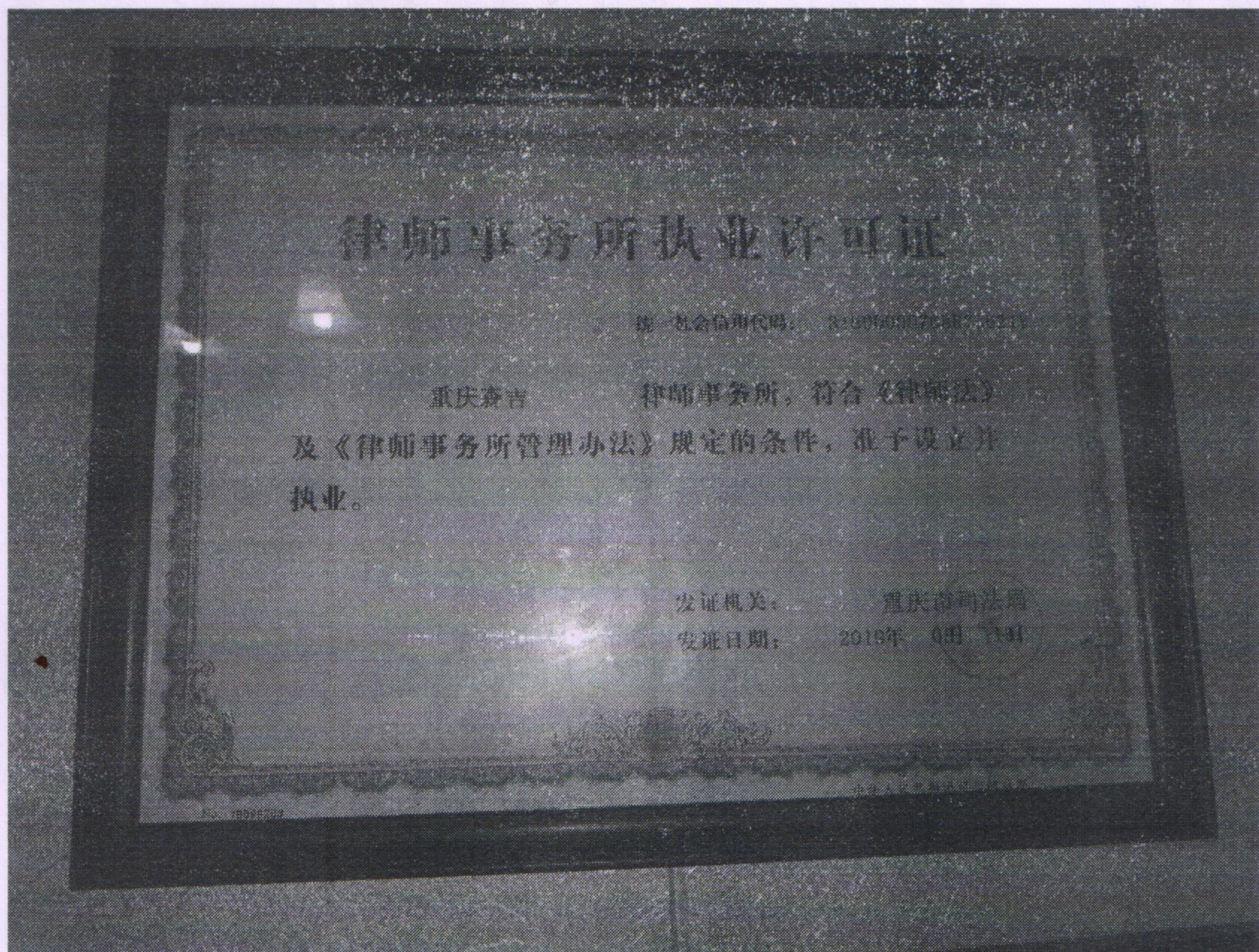
附件 1：律师事务所执业许可证（复印件，加盖公章）：