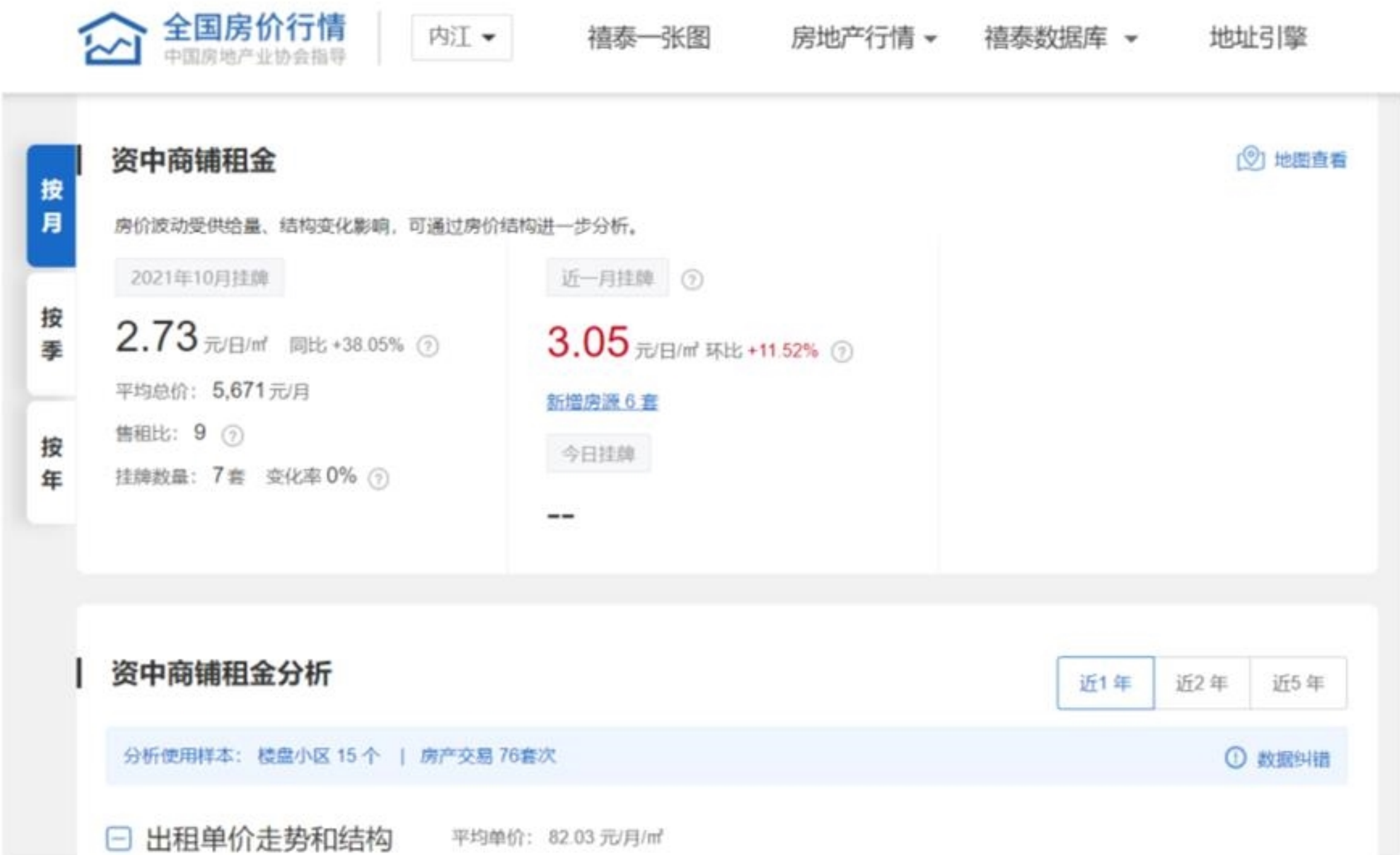
资中县商铺租金情况

参考资中县商铺出租情况，本项目配套商业每月租金按 55 元/m 2 进行测算。租金价格每 3 年增长 10%，债券存续期内，租金年均复合增长率 3.06%。2020 年四川省居民消费价格（CPI）比上年上涨 3.2%，本项目租金涨幅低于 2020 年四川省 CPI 涨幅。