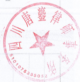
律师事务所变更登记（一）