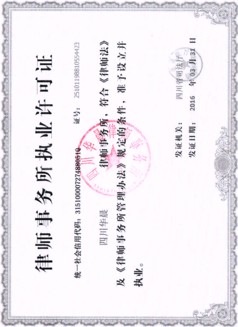
附件 1：四川华晨律师事务所执业许可证（正本）