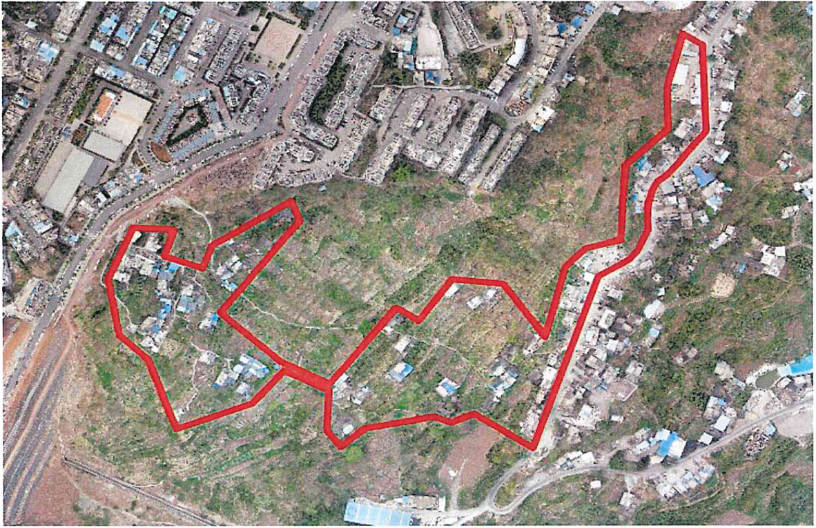
图 1 红阳片区改造范围示意图