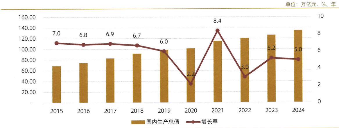
图表2：2015~2024年我国国内生产总值及增长率

2024年中国经济运行总体平稳，并呈现出较强的韧性，四个季度的经济运行节奏呈“U型”走势。其中，在内需偏弱的拖累下，二、三季度经济运行边际走弱，但在7月及9月中央政治局会议两次加力部署增量政策的支撑下，四季度我国宏观经济显著回升，同比增长5.4%，相较三季度加快0.8个百分点。在四季度宏观经济稳中有升的过程中，消费和服务业回升势头更强，或表明经济产需两端的正向循环趋势正在逐步确立。从宏观经济运行的主要经济指标来看，2024年中国经济运行体现出以下特征：一是工业与服务业生产保持韧性，高技术相关的生产增速较高；二是固定资产投资内部分化，出口对于制造业投资形成了较强拉动；三是价格水平总体偏低，但核心CPI好转反映出内需边际改善；四是企业、居民、政府三大主体收入状况皆有一定好转。