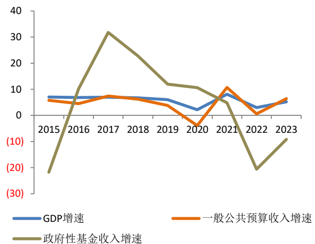
图 2：2015 年以来全国 GDP、一般公共预算收入、政府性基金收入增速（%）