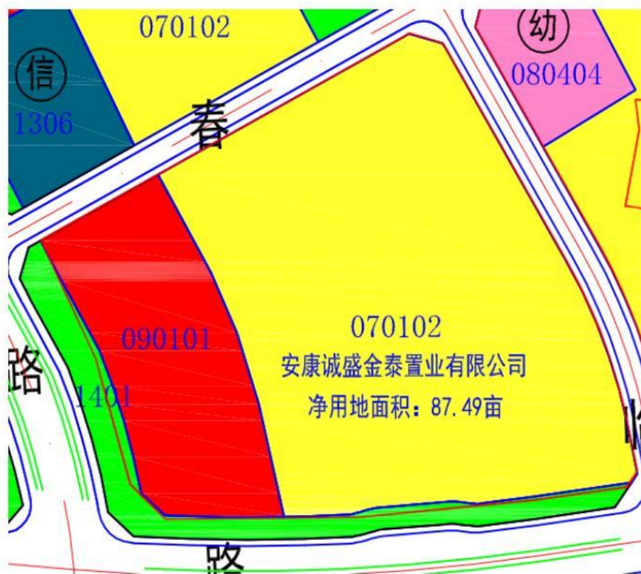
图 2-1 项目所在区位图