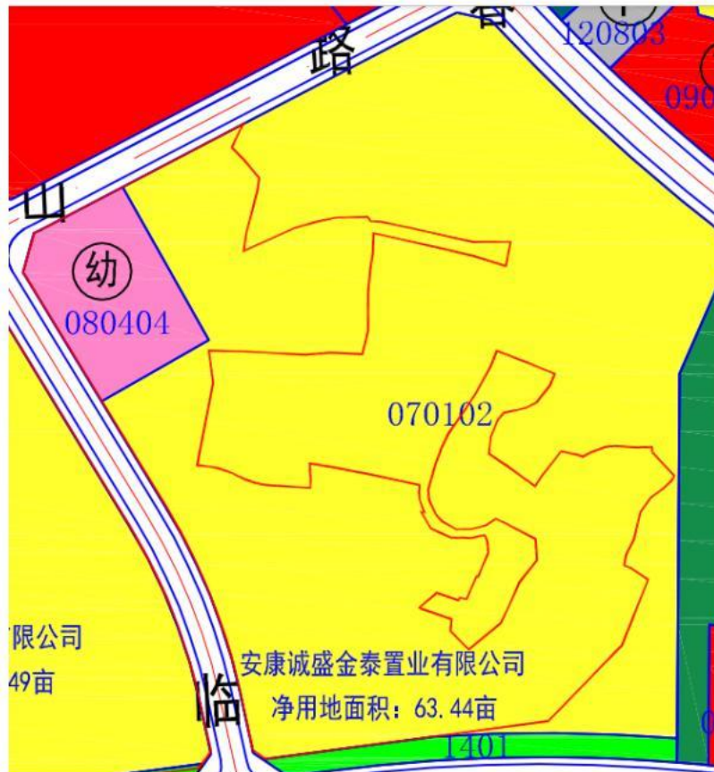
图 2-1 项目所在区位图