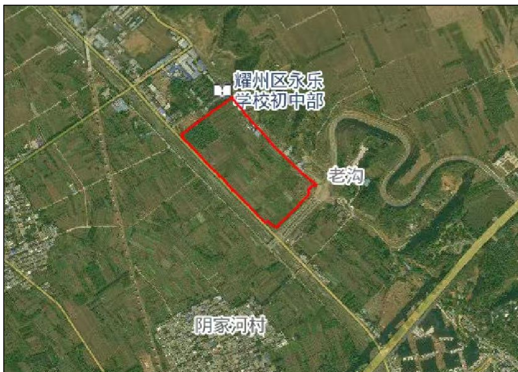
图1-项目区域位置示意图