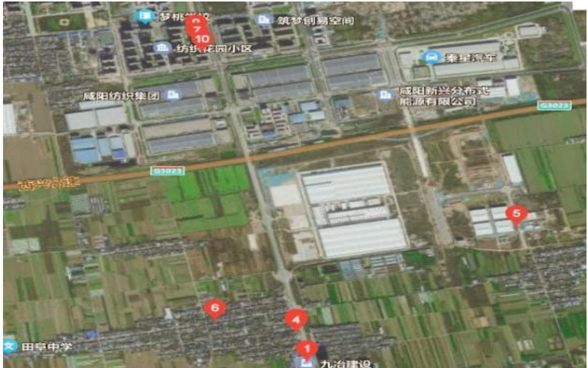
图 1-1 项目所在区位图

项目选址位于纺织二路、纺织大道、科技大道、高新大道、纺织四路、留印路、支一路。项目区位图如下图 1-1 所示。