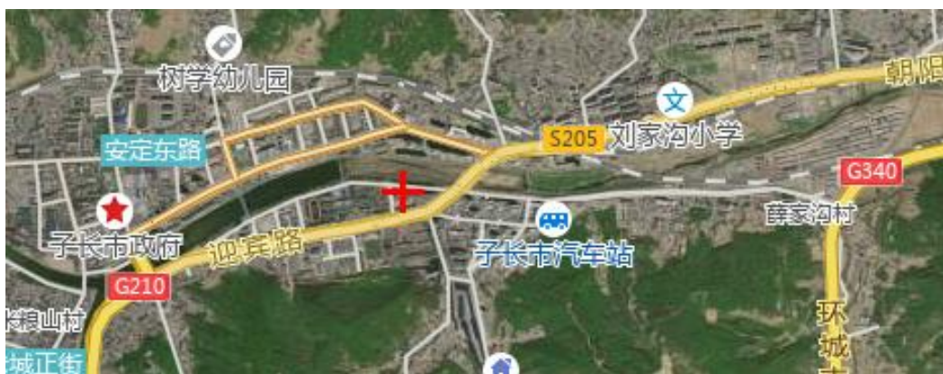
图 1-1 项目所在区位图