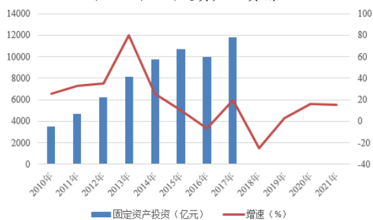
图 2 新疆固定资产投资情况

注：2018 年起，新疆未披露固定资产投资额的绝对值