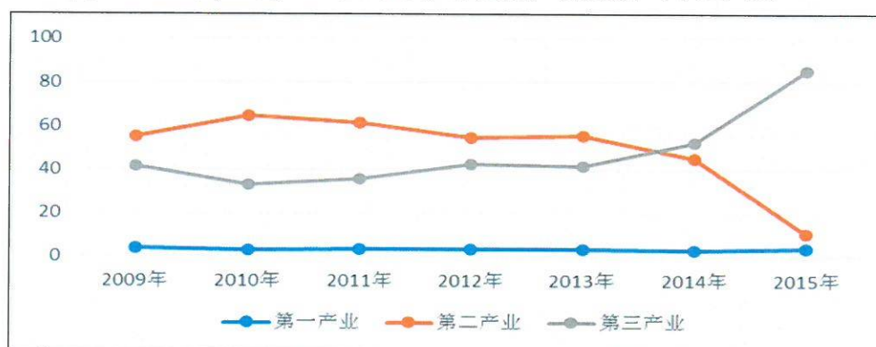
图表 10. 大连市三次产业对地区生产总值增长的贡献率 (单位：%)

注：根据《大连统计年鉴》及 2014-2015 年大连市国民经济和社会发展统计公报整理