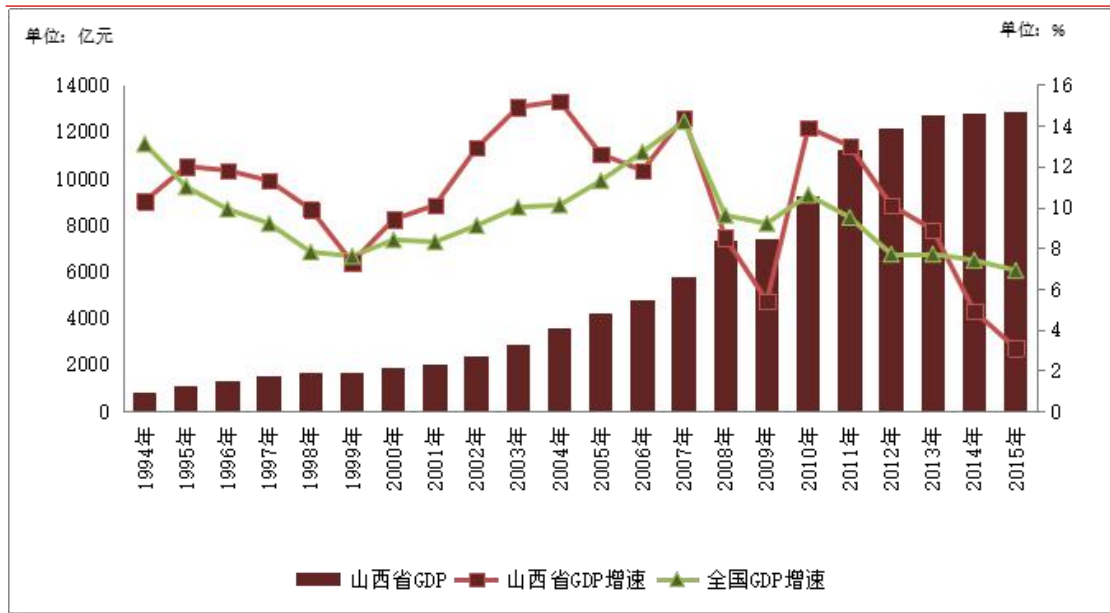
图 2：山西省 1994 年~2015 年地区生产总值和增速情况