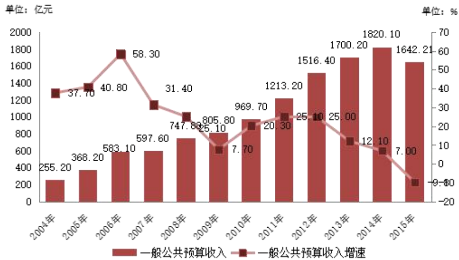
图 3：2004 年~2015 年山西省一般公共预算收入和增速情况

资料来源：山西省 2004 年~2015 年国民经济和社会发展统计公报，东方金诚整理