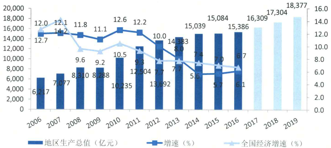
图1 黑龙江地区生产总值及增速