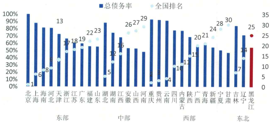
图5 2012年末各省级行政区政府性债务率