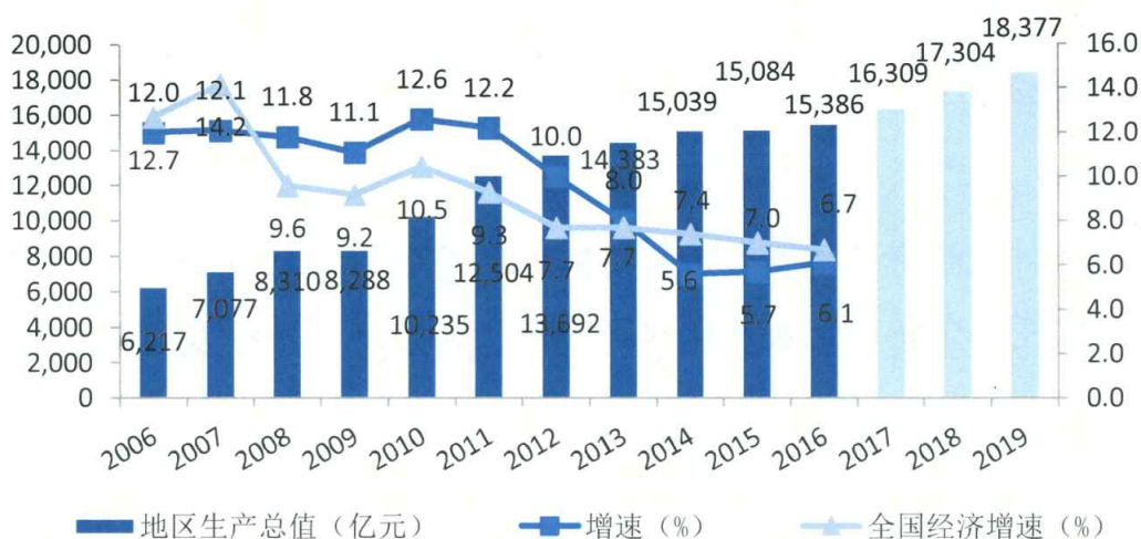
图1 黑龙江地区生产总值及增速

数据来源：2006~2016年黑龙江省国民经济和社会发展统计公报，2017~2019年地区生产总值为大公预测。