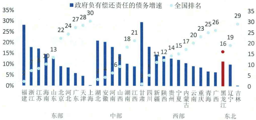
图4 2013年上半年各省级行政区政府负有偿还责任债务增速