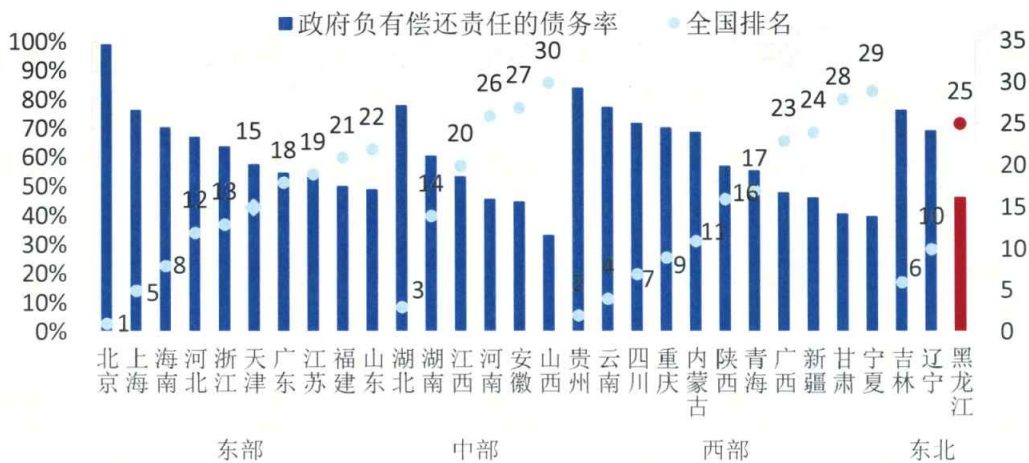
图6 2012年末各省级行政区政府负有偿还责任的债务率