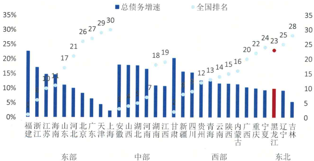
图3 2013年上半年各省级行政区政府性总债务增速

债务压力方面，根据审计署公布的2013年6月末各省地方政府审计结果，截至2012年末黑龙江总债务率为54.4%，在30个省的从高到低排名中居第25位，政府有偿还责任债务的债务率为45.9%，从高到低排名第25位。总体来看，黑龙江整体债务压力不大。