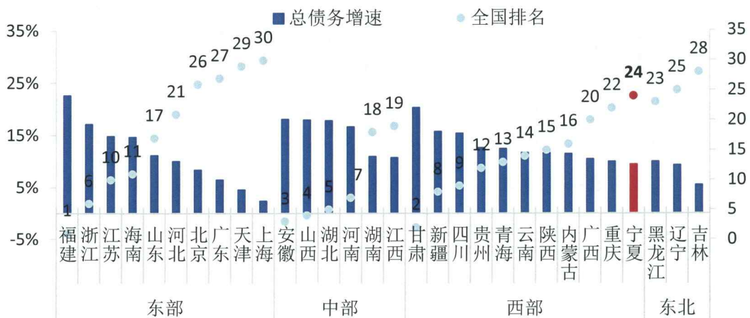
图 3 2013 年上半年各省级行政区政府性总债务增速

宁夏当前财富创造能力与全国其他省份相比较低，宁夏经济增长依靠投资拉动，煤炭开采、化工等第二产业行业是经济发展主导行业，经济发展方式较为粗放，信用资源对经济增长的支撑作用有待提升，这将在一定程度上限制宁夏的债务偿付能力。然而，宁夏作为全国首个内陆开放型经济试验区，具有向西对外开放的历史和文化优势，正处于快速发展的黄金期。得益于良好的发展环境和政策，传统产业转型升级和新兴产业、特色产业发展将成为宁夏增长的新动力。另外，“一带一路”战略的实施将大力带动宁夏经济的发展，为其注入强大动力。未来经济发展潜力有助于增强宁夏财政实力。