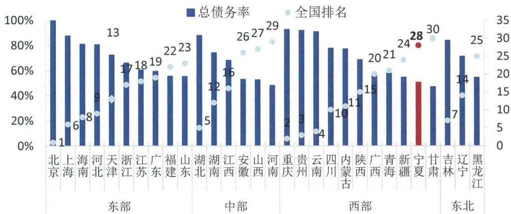
图 5 2012 年末各省级行政区政府性债务率

债务压力方面，根据审计署公布的 2013 年 6 月末各省地方政府审计结果来看，截至 2012 年末宁夏总债务率在 30 个省排名 10 第 28 位，政府有偿还责任债务率排名第 29 位，债务负担很轻。