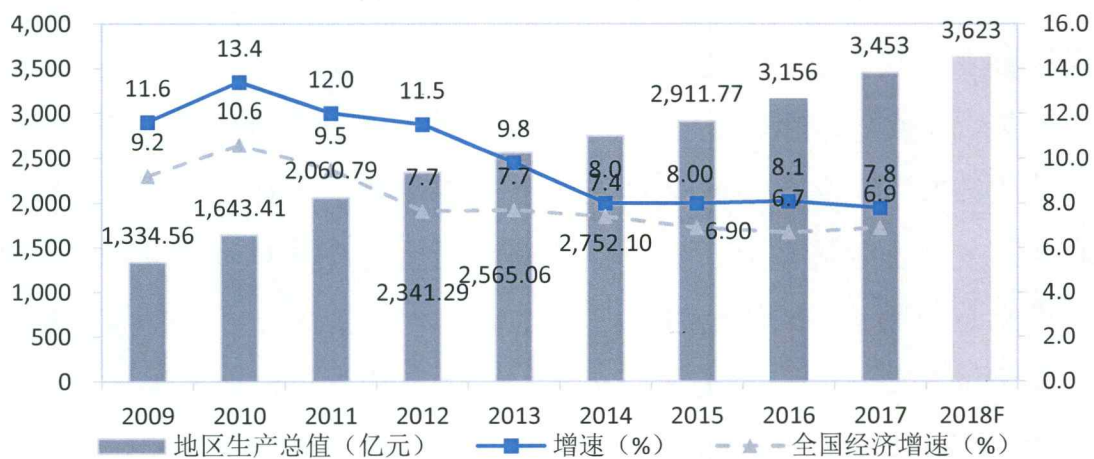
图 1 宁夏地区生产总值及增速