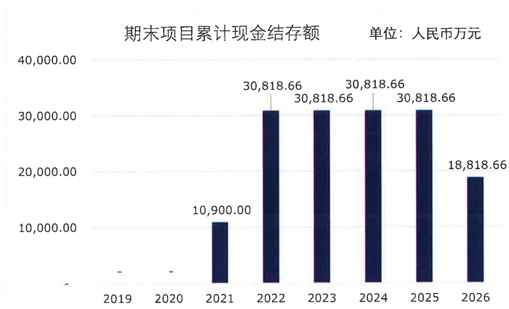
图 2 债券存续期内资金留存情况

综上，针对三江县 2015-2017 年城市棚户区（城中村）改造项目在政府专项债券存续期内还本付息资金的测算，我们未注意到可能对相关项目资金稳定性产生重大影响的情况。