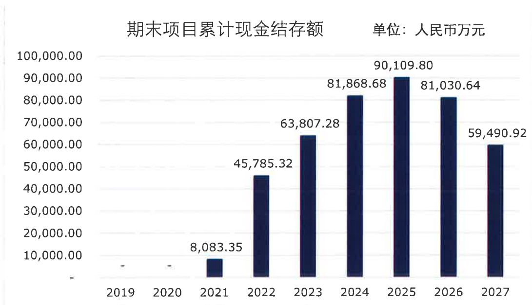
图 4 债券存续期内资金留存情况

综上，针对鹿寨县鹿寨镇片区棚户区改造项目在政府专项债券存续期内还本付息资金的测算，我们未注意到可能对相关项目资金稳定性产生重大影响的情况。