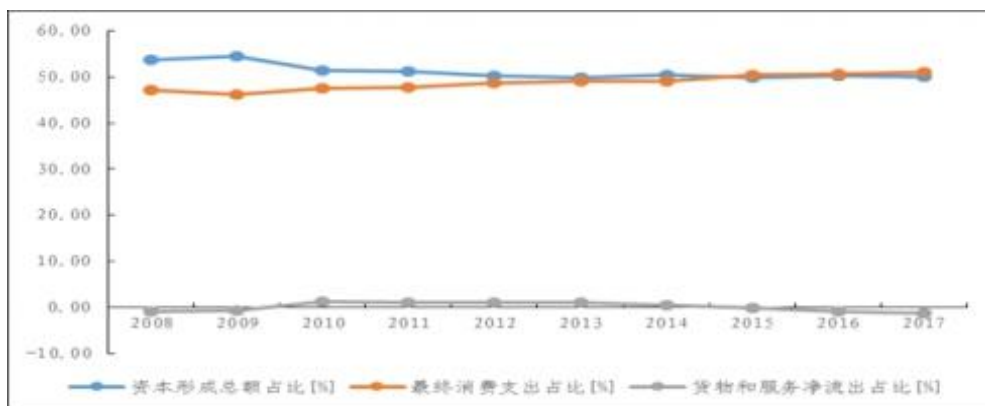
图表 5. 江西省地区生产总值支出法构成 (单位: %)

从经济增长的动力结构看，投资和消费是拉动江西省经济增长的主要动力，近年来对江西省地区生产总值的贡献率合计保持在 98% 以上。2010 年以来，在调整经济发展方式及扩大内需的大背景下，投资对江西省经济增长的贡献率波动下滑，消费对经济增长的贡献率逐年提升。2015-2017 年，全省最终消费率分别达 50.34%、50.61% 和 51.10%，分别超过同期资本形成率 0.57 个、0.32 个和 0.99 个百分点。