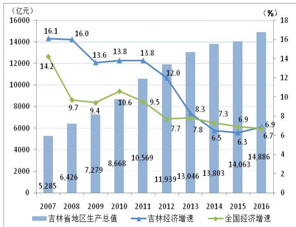
图 1 吉林省地区生产总值及增速情况

注：地区生产总值按当年价格计算；增速按不变价格计算，即上年=100