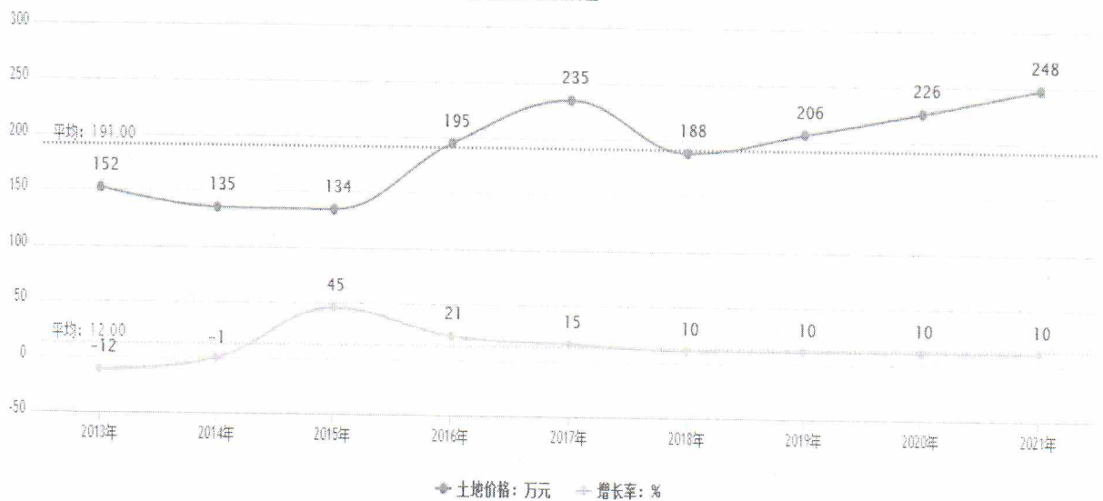
土地价格预测趋势图

根据项目建设期预测，项目完全拆迁完毕达到净地出让条件的的时间预计为2020年，2018年地价基数以2015-2017年三年平均值测算，土地价格增长率按照2013-2017年度平均增长率13.6%下浮3.6%测算，由此预测2020年及未来15年度该项目土地出让价格约为340万元/亩，对应该项目所产生的项目土地出让收益约为135050万元。