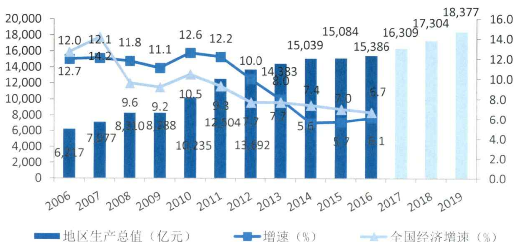
图1 黑龙江地区生产总值及增速

数据来源：2006~2016年黑龙江省国民经济和社会发展统计公报，2017~2019年地区生产总值为大公预测。