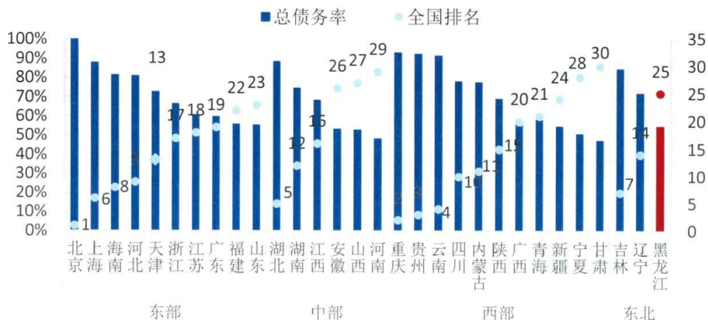
图5 2012年末各省级行政区政府性债务率