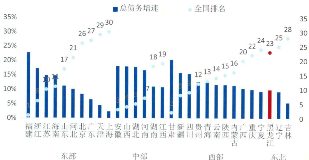
图 3 2013 年上半年各省级行政区政府性总债务增速

债务压力方面，根据审计署公布的 2013 年 6 月末各省地方政府审计结果，截至 2012 年末黑龙江省总债务率为 54.4%，在 30 个省的从高到低排名中居第 25 位，政府有偿还责任债务的债务率为 45.9%，从高到低排名第 25 位。总体来看，黑龙江整体债务压力不大。