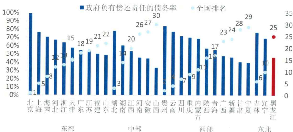
图6 2012年末各省级行政区政府负有偿还责任的债务率