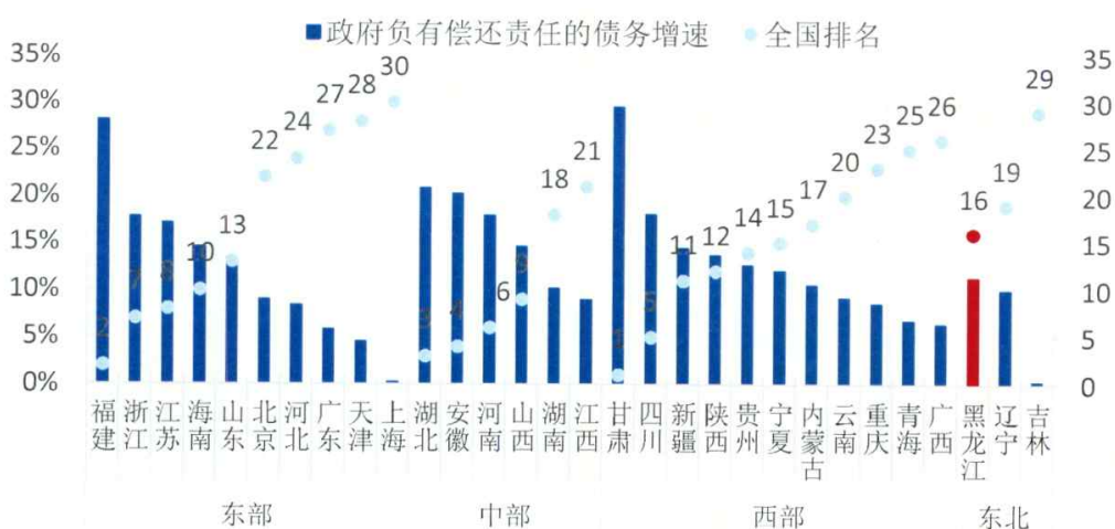
图 4 2013 年上半年各省级行政区政府负有偿还责任债务增速