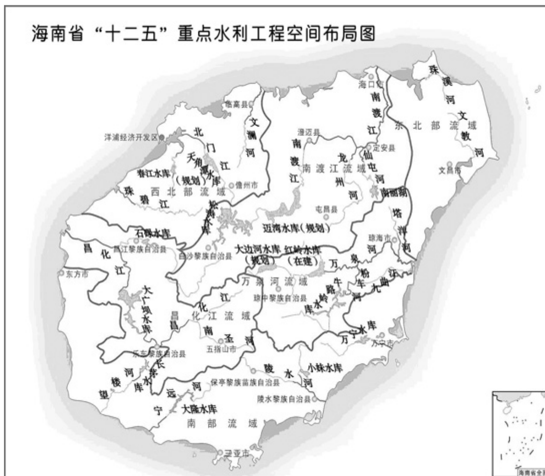
海南省“十二五”重点水利工程空间布局图

(四)核电及能源建设。按照电力先行的原则，建设好昌江核电一期两台六十五万千瓦核电机组项目，同时建设六十万千瓦装机容量的琼中抽水蓄能电站。积极推进昌江核电二期建设，确保建成华能东方电厂两台三十五万千瓦燃煤发电机组扩建工程。建设东部燃气电厂和西南部电厂或海口电厂五期燃煤机组。加快海南电网跨海联网二期建设，对全岛城镇、农村电网进行升级改造。加强琼粤两省电力交换能力，积极推进智能电网建设，确保电网高效安全，稳定经济运行水平。积极发展风能、水能、太阳能等清洁能源。统筹利用好天然气等各种气源，形成互相调配、互为补充的格局。建成洋浦 300 万吨液化天然气(LNG)站线项目，确