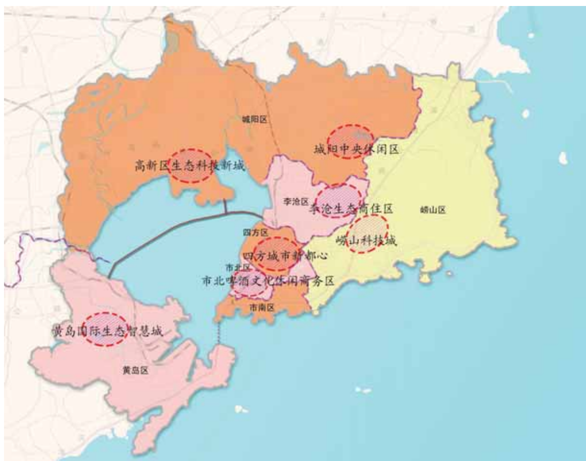
“十二五”中心城区重点发展区域示意图

推进重要节点建设。加快市南国际航运服务区、市北小港湾、四方滨海新区、李沧交通商务区、城阳国际航空城、黄岛北部城区等环湾节点建设。谋划发展潜力大、带动能力强的新片区建设，重点推进市北啤酒文化休闲商务区、四方城市新都心、李沧生态商住区、城阳中央休闲区、崂山科技城、黄岛国际生态智慧城建设，增强中心城区功能。以办好2014年世界园艺博览会为契机，完善周边区域基础设施，提升服务功能，带动北部城区发展。