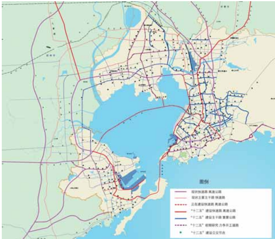
“十二五”中心城区路网规划示意图