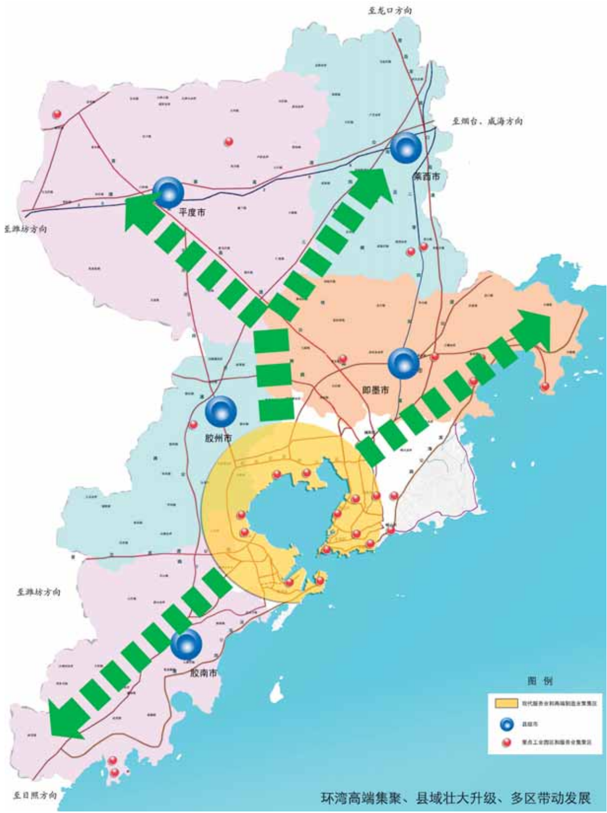
“十二五”产业发展布局示意图