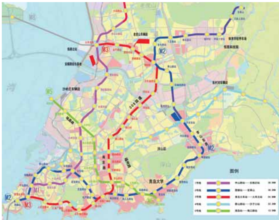
市区轨道交通线路示意图