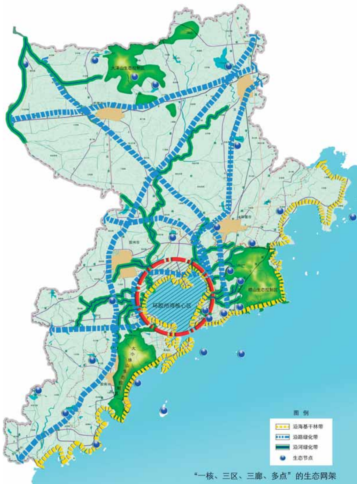
“十二五”生态建设布局示意图