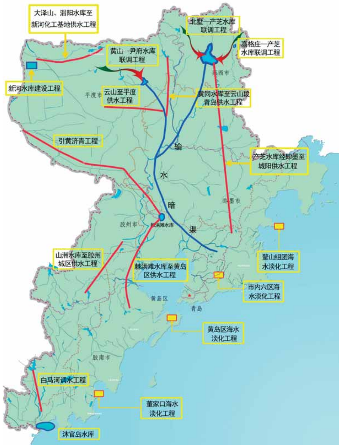
“十二五”城市供水水源及配置工程示意图